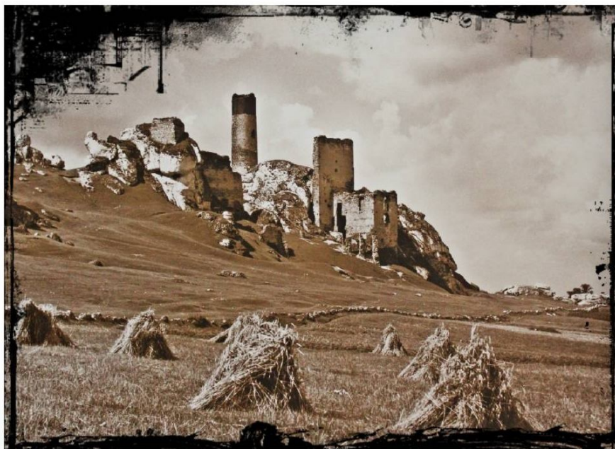
Czesław Bankiewicz - Zamek w Olsztynie