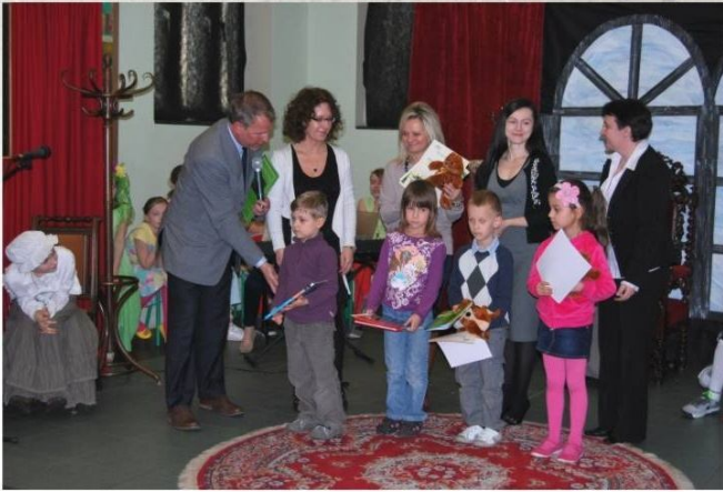
Laureaci konkursu w kat. wiekowej, przedszkola wraz z opiekunami

Prace znajdujące się na wystawie wykonane zostały w tradycyjnych technikach malarskich (akwarela, tempera, farby wodne). Warto podkreślić, że dzieci pokazały przyrodę z niezwykłą starannością.