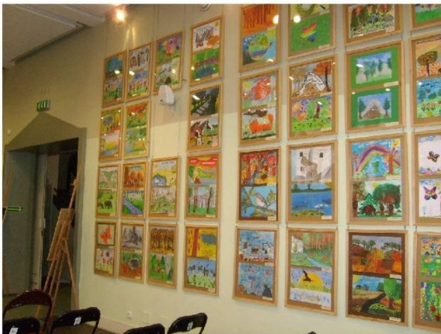
Wystawa pokonkursowa

Prace znajdujące się na wystawie wykonane zostały w tradycyjnych technikach malarskich (akwarela, tempera, farby wodne). Warto podkreślić, że dzieci pokazały przyrodę z niezwykłą starannością.