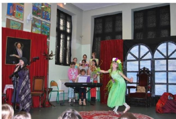
Tajemniczy ogród inscenizacja w wykonaniu uczniów SP nr 40 w Częstochowie

Młodzi aktorzy zostali nagrodzeni gromkimi brawami, po czym zaprosiliśmy wszystkich do zwiedzania wystawy.